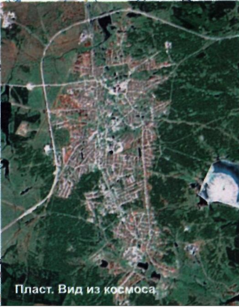
Пласт. Вид из космоса