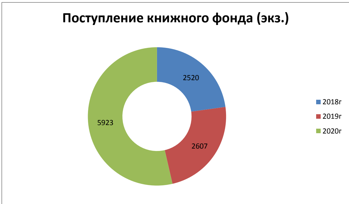
Таблица 9 Финансирование комплектования и подписки 2018-2020 гг. «МЦБС» Пластовского муниципального района